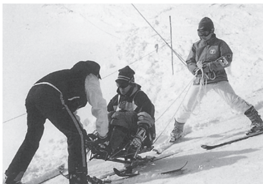
◀助成団体：日本二分脊椎症協会 大阪支部 助成基金：メトロニック福祉基金