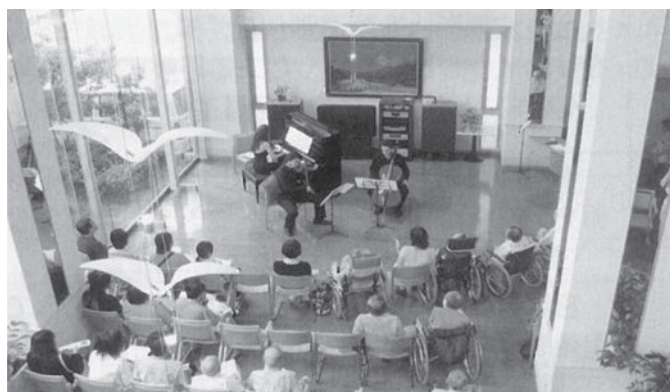
◀助成団体：プラハ・ガリアーノ室内楽実行委員会 助成基金：レイク夢・未来・ユース基金