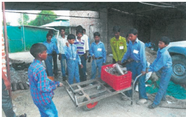
◀助成団体：特定非営利活動法人 アーシャ=アジアの農民と歩む会 助成基金：がっこう基金