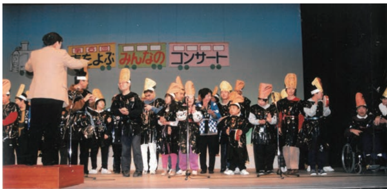
◀助成団体：第6回「春をよぶみんなのコンサート」実行委員会 助成基金：Panasonic 共生社会基金