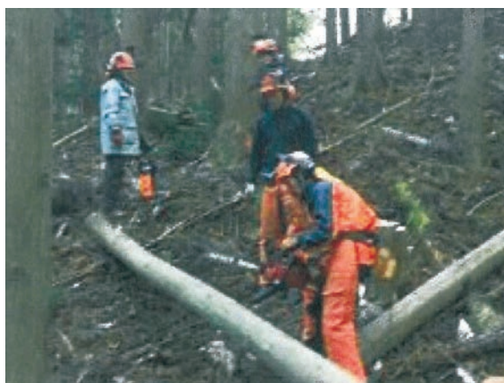
◀助成団体：特定非営利活動法人 吉里吉里国 助成基金：東日本大震災及び原発災害からの復旧・復興活動等支援基金 分野1