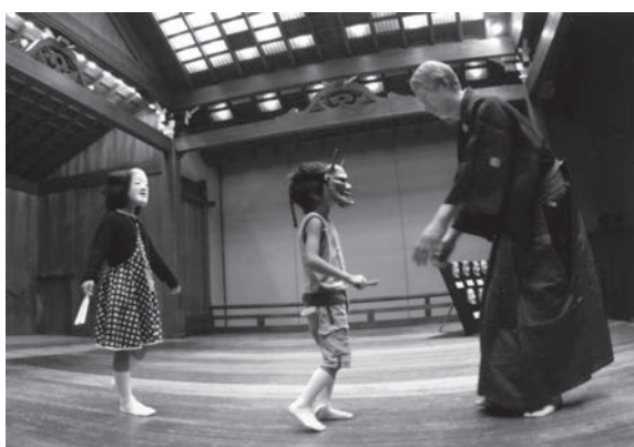
◀助成団体：財団法人大槻能楽堂 助成基金：片山千歳古典芸能振興基金