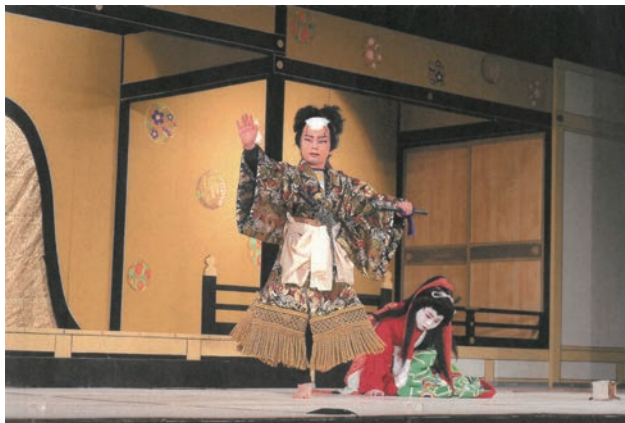
◀助成団体：まるおか子供歌舞伎を支える会 助成基金：片山千歳古典芸能振興基金