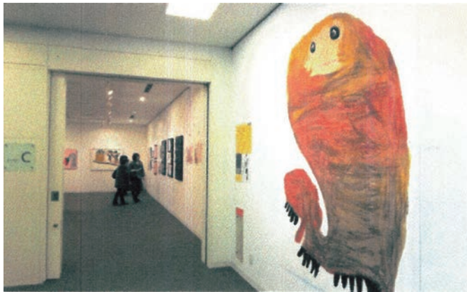
◀助成団体：特定非営利活動法人 障害者芸術推進研究機構 助成基金：山口淑子友愛基金