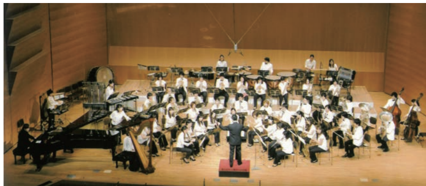
▲助成団体：特定非営利活動法人 フィルハーモニック・ウインズ大阪 助成基金：大塚伸二基金