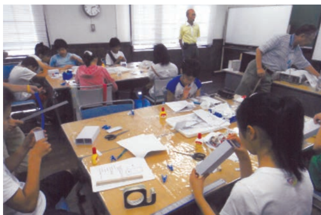
◀助成団体：人と化学をむすぶ会 助成基金：匿名基金No.16