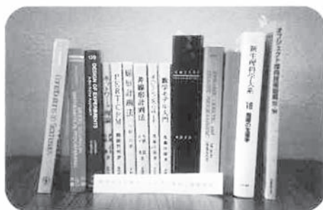
◀助成団体：関西大学工学部 助成基金：フジキン小島・小川科学教育振興基金