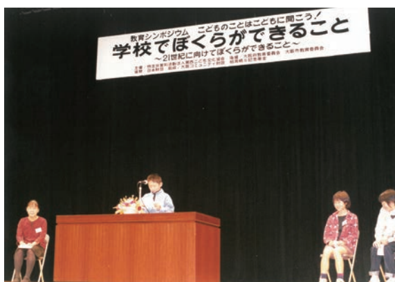
◀助成団体：関西子ども文化協会 助成基金：柏岡精三記念基金