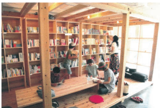
◀助成団体：一箱本送り隊 助成基金：東日本大震災復興基金