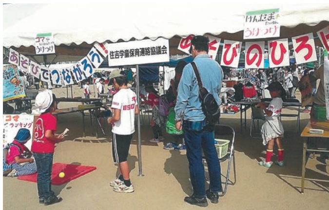
◀助成団体：うさぎ学童保育所 助成基金：大阪厚生信用金庫地域・社会貢献基金 江田直介・静子健やかな青少年育成基金