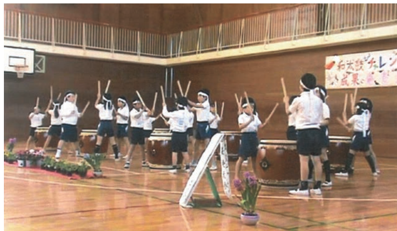
◀助成団体：特定非営利活動法人 和太鼓教育研究所 助成基金：レイク夢・未来・ユース基金