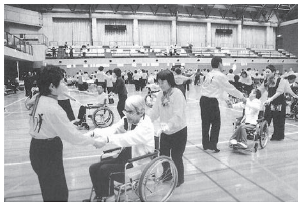
▲助成団体：特定非営利活動法人 車椅子社交ダンス普及会 助成基金：Panasonic 共生社会基金