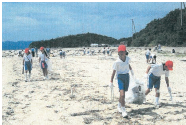
◀助成団体：海守さぬき会 助成基金：東洋ゴムグループ環境保護基金