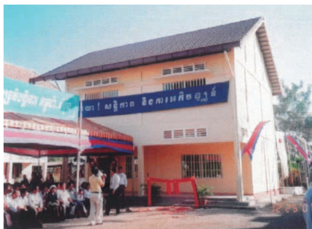
▲助成団体：特定非営利活動法人 JHP学校をつくる会 助成基金：がっこう基金／節子基金